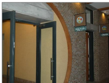
②北エレベーター入口があります