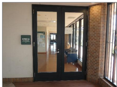
⑥依存症外来入口です