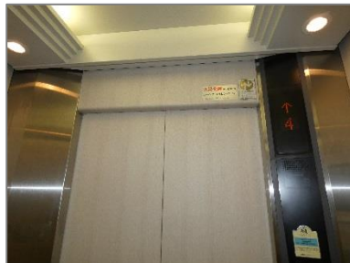
⑤4階で降りて左手が…