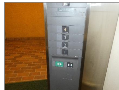
④依存症外来は4階です