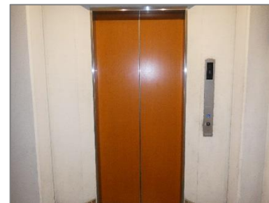
③北エレベーターに乗ります